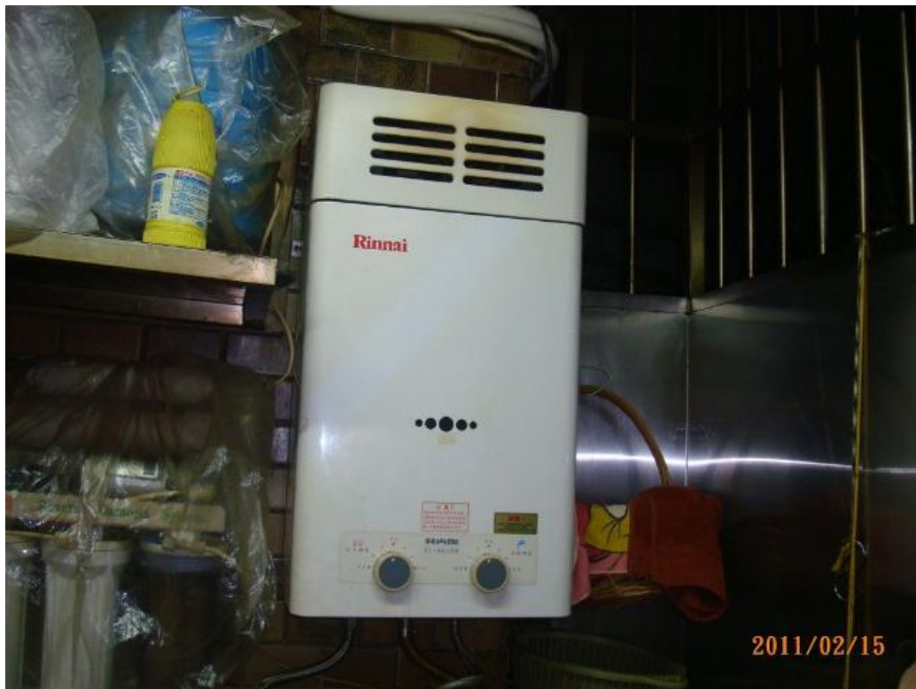
RF 式熱水器裝設於屋內範例圖