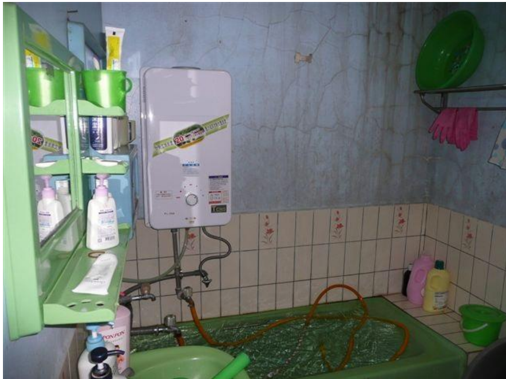
CF 式熱水器未裝設排氣管範例圖