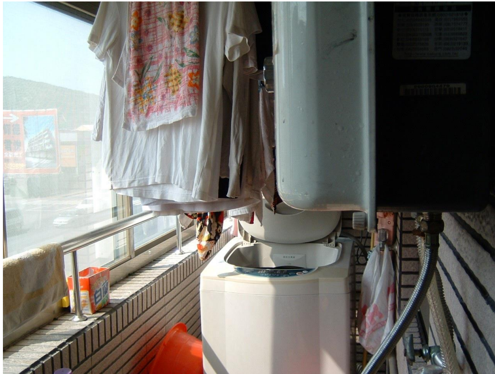
RF 式熱水器裝設於加蓋陽台範例圖